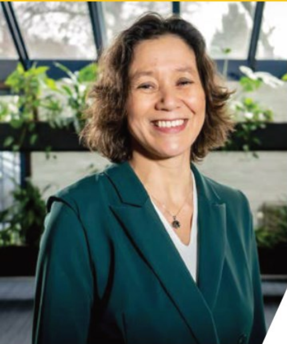
Dr.ir. [redacted] Directeur Publieke Gezondheid GGD Gelderland-Zuid